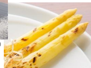
(ホワイトアスパラガスイメージ)

《昼食》「レストラン ボヌール」 浄法寺産ホワイトアスパラガス「白い果実」と二戸のブランド肉「短角牛」をつかったツアー限定のスペシャルランチを堪能♪