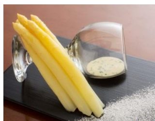
(ホワイトアスパラガスイメージ)

《午前》「馬場園芸」 ホワイトアスパラガスの栽培現場を見学。 採れたてホワイトアスパラガスの試食や野菜の直売もあります♪ 「産直キッチンガーデン」 浄法寺の新鮮な冬野菜をGET!!