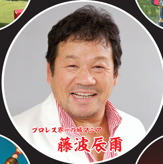
プロレス界一の城マニア 藤波辰爾